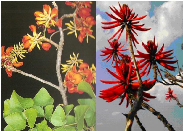
Erythrina velutina , E. speciosa mulungu