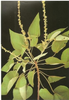
Croton urucurana sangue-de-drago