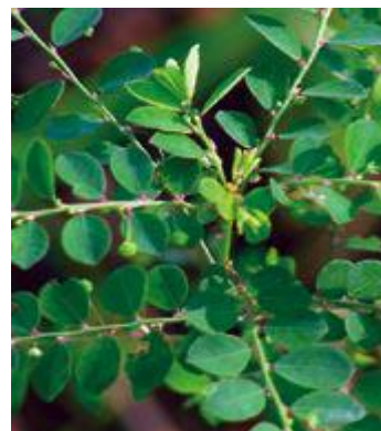
Phyllanthus amarus , P. niruri , P. tenellus P. urinaria quebra-pedra