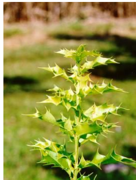
Maytenus ilicifolia espinheira-santa