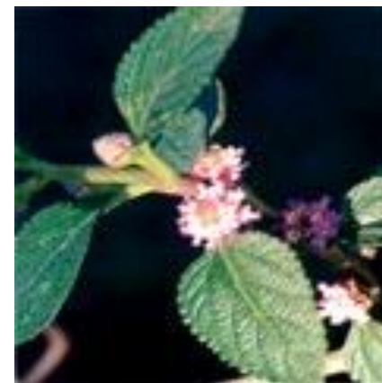
Lippia alba erva cidreira