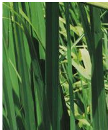
Cymbopogon citratus capim limão