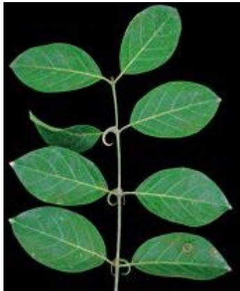
Uncaria. guianensis unha – de-gato