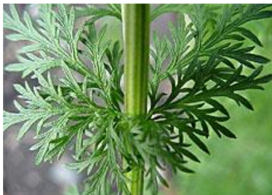
Artemisia annua L.