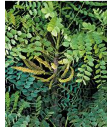
Stryphnodendron adstringens barbatimão