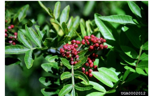
Schinus terebinthifolius aroeira-da-praia