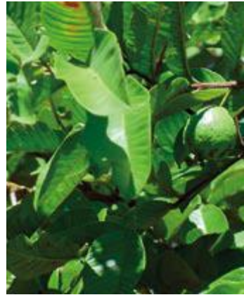
Psidium guajava goiabeira