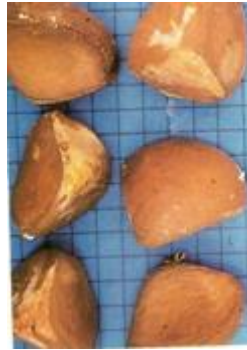
Carapa guianensis andiroba