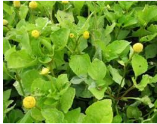
Acmella oleracea , jambu