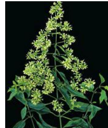
Mikania glomerata , M. laevigata guaco, folhas