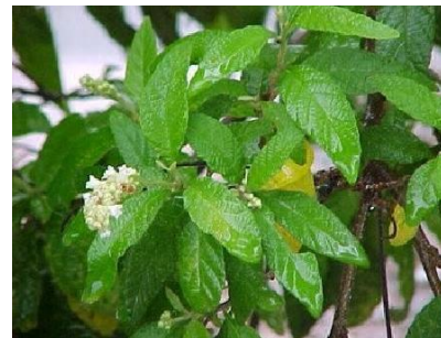
Cordia verbenacea , erva-baleeiro