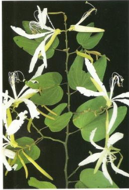
Bauhinia forficata pata-de-vaca