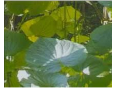
Piper umbellatum , P. peltatum , pariparoba