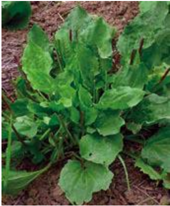
Plantago major P. lanceolata tanhagem