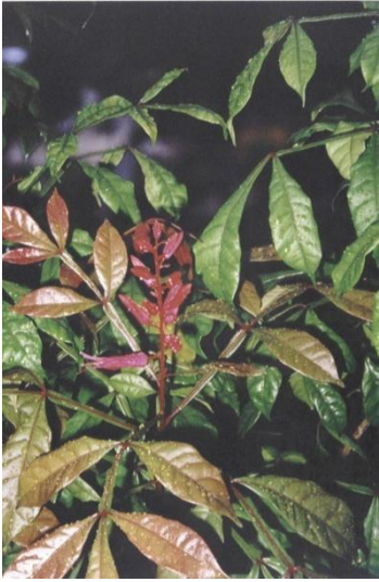
Quassia amara quina- quina, quássia