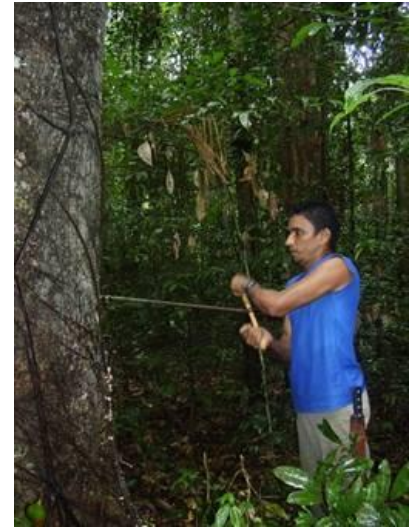
Copaifera spp óleo de copaíba